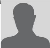
Fabienne Labelle Pichevin Maître de Conférences en droit privé